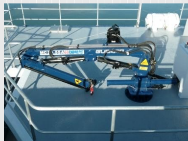
Grue hydraulique de débarquement de la pêche