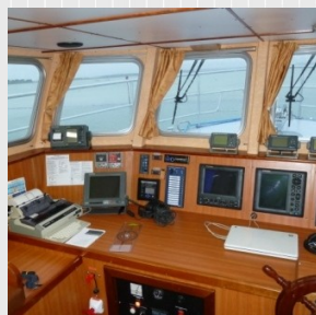
Timonerie et électronique de bord