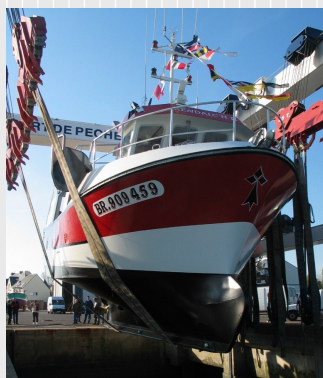
Mise à l'eau