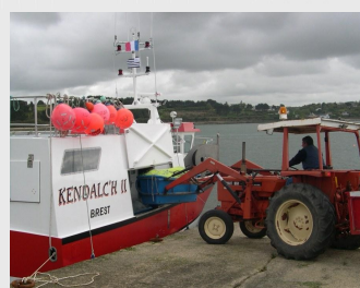
Embarquement du matériel