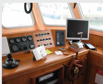
Un poste de pilotage moderne