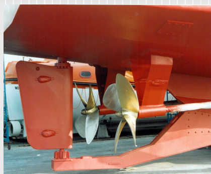
Double motorisation pour plus de performance