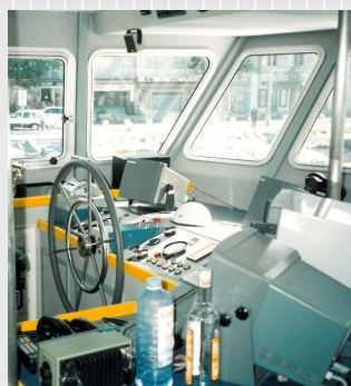
Un poste de pilotage moderne et ergonomique