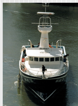
Timonerie surélevée d'une vigie pour la recherche des bancs de poissons