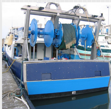
Portique aluminium et triple enrouleurs