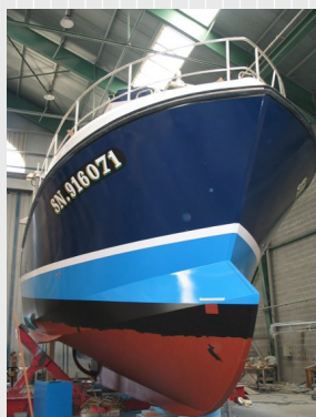
Dernières finitions avant mise à l'eau