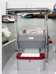
T-Top Aluminium (Option)

La Jonchère du Prince BP 33 – 44490 Le Croisic France