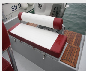
Banquette arrière avec coffre