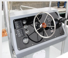
Tableau électrique design