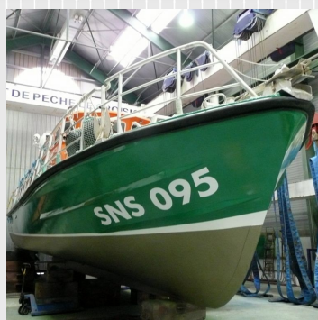
Derniers préparatifs avant mise à l'eau