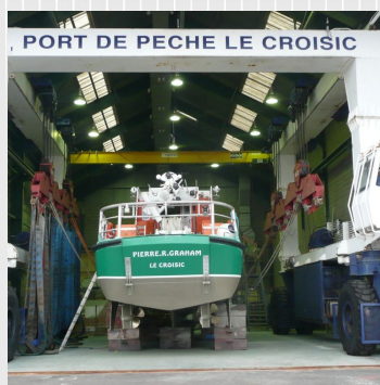
Mise à l'eau