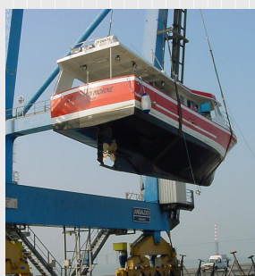
Embarquement à Saint Nazaire