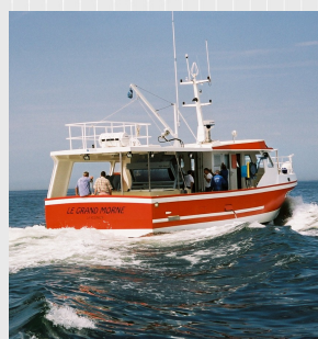
Un carré confortable et spacieux