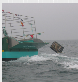
Filage concluant en toute sécurité