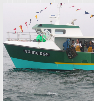
Virage des casiers