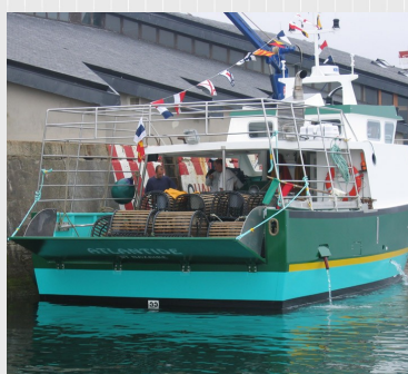
Premiers essais de filage des casiers