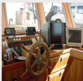
Aménagement de la timonerie