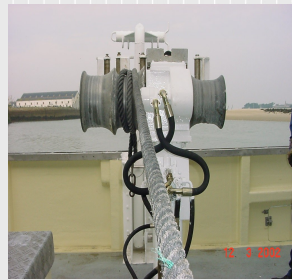
Cabestan de virage de la coulisse