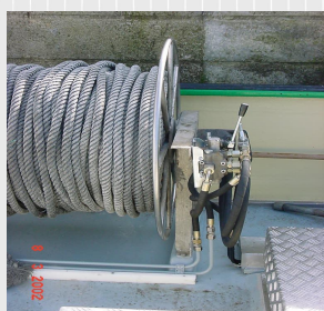
Treuil de stockage de la coulisse